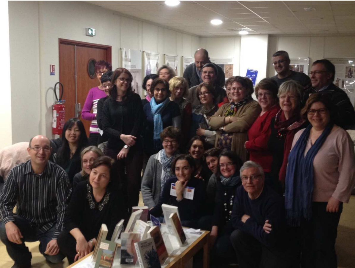
Les membres du jury en Allemagne